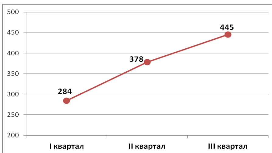
Число протестов в 2017 году

На протяжении 2017 года количество протестов непрерывно возрастало : даже несмотря на «вспышки» протестной активности, связанные с деятельностью Алексея Навального (26 марта в I квартале и 12 июня во II квартале), и протестами дальнбойщиков во многих регионах страны в I и II квартале года, в III квартале 2017 года было выявлено еще большее число протестных акций: