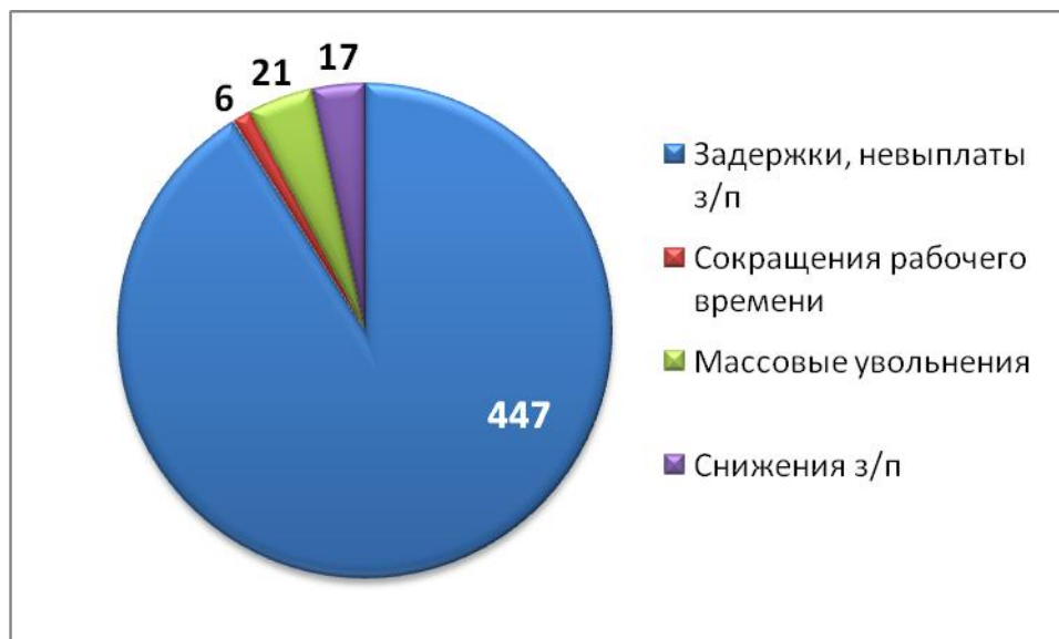
Конфликтные случаи, связанные с трудовыми отношениями, в III квартале 2017 г.

Подавляющее большинство трудовых конфликтов (в том числе не переросших в открытый протест) на предприятиях в III квартале 2017 года было связано с задержками и невыплатами заработной платы: