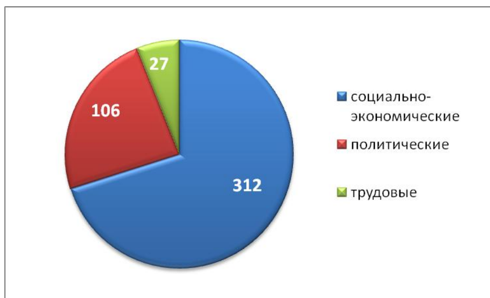
Протесты в III квартале 2017 года

В III квартале 2017 года около 70% протестных акций составили акции, связанные с социально-экономической тематикой :