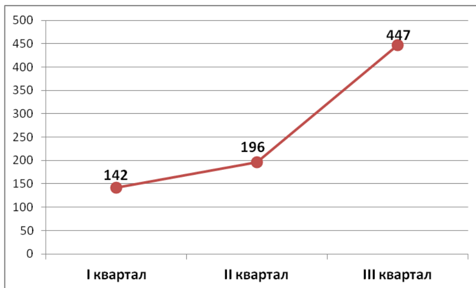
Число случаев задержек и невыплат зарплат в 2017 году

Проблемы на предприятиях в ряде случаев привели к открытому протесту. В III квартале 2017 года ЦЭПР зафиксировал 27 трудовых протестов , наибольшее число – в Ростовской области и Приморском крае.